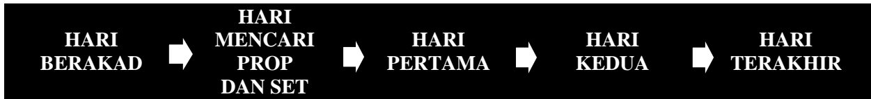
Rajah 3: Struktur persembahan ritual magbuaya

bahawa identiti itu terbentuk dengan cara wawancara dan secara performatif. Oleh yang demikian, identiti itu tidak terbentuk secara semulajadi dalam sesuatu masyarakat. Oleh yang demikian, peranan wanita serta identiti wanita dapat dilihat secara jelas dalam aliran persembahan ritual magbuaya .