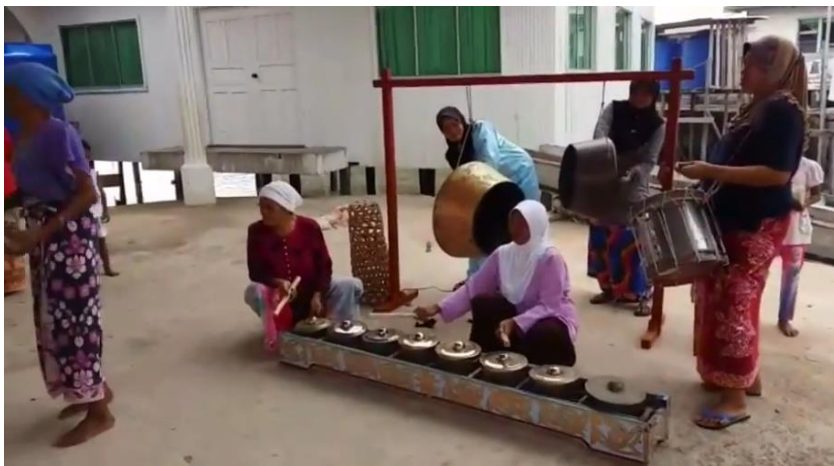
Rajah 4: Lima orang pemuzik yang terdiri dalam kalangan wanita.

Lima orang pemuzik wanita pula dipilih berdasarkan mandat daripada makhuk halus yang mengkhaskan mereka untuk memainkan muzik bagi persembahan ritual magbuaya yang diterima melalui mimpi. Dalam mimpi tersebut, mereka melihat cahaya muncul sambil diiringi bunyi muzik tagunggu’ titik limbayan . Antara alat muzik yang dimainkan adalah gong ( agong ), gendang ( tambul ) dan kulintangan. Para pemain muzik ini akan memulakan paluan titik limbayan bermula sejak dari selepas solat zuhur yang dimulai dengan paluan gong sebanyak tiga kali sebagai tanda permulaan persembahan ritual pengubatan magbuaya .