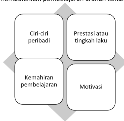
Rajah 2.2 Komponen Pembelajaran ArahanKendiri Sumber: LeJeune (2002)

LeJeune (2002) telah memperkenalkan model yang berkaitan pembelajaran arahan sendiri yang mempunyai kaitan dengan pembelajaran dewasa. Menurut beliau, terdapat empat komponen utama yang penting untuk pembelajaran arahan sendiri iaitu ciri-ciri peribadi individu, keupayaan dan kemahiran, prestasi atau tingkah laku seseorang dan motivasi individu ke arah pembelajaran. Setiap ciri mempunyai peranan yang tersendiri untuk membolehkan pembelajaran arahan sendiri berlaku dalam kalangan dewasa.