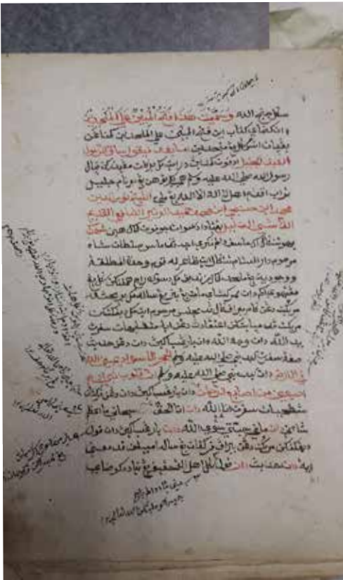
Rajah 2 Manuskrip MSS 3008, Pusat Manuskrip Melayu, Perpustakaan Negara Malaysia.

4. Naskhah bernombor 17667 di Perpustakaan Dewan Bahasa dan Pustaka Manuskrip ini ada dalam simpanan Teuku Iskandar sehingga ke akhir