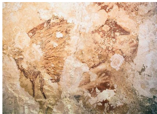
Foto 2: Lukisan dalam Pecahan Imej daripada Babirusa ( Babirousa sp. ) dan Stensil Tangan dari Salah Satu Gua di Sulawesi, Indonesia

Setelah selesai penyelidikan pada tahun 2001, kumpulan penyelidik diketuai oleh Graeme Barker (2016) seterusnya menyambung kembali penyelidikan pada 8 April 2002. Penyelidikan ketiga menguatkan lagi bukti kedatangan masyarakat prasejarah ke Lobang Kuala ( West Mouth ) sebelum 43, 000 S.M. Ia juga membawa kepada peningkatan bukti wujudnya sistem penternakan sejak adanya masyarakat moden di Borneo. Di antara objektif penyelidikan itu ialah untuk mengumpul informasi berkaitan pendudukan Pleistocene, mengumpul material yang diperlukan untuk pengebumian, dan untuk mengetahui aktiviti penternakan dan pertanian. Mereka turut menemui banyak tulang haiwan di sekitar Kompleks Gua Niah.