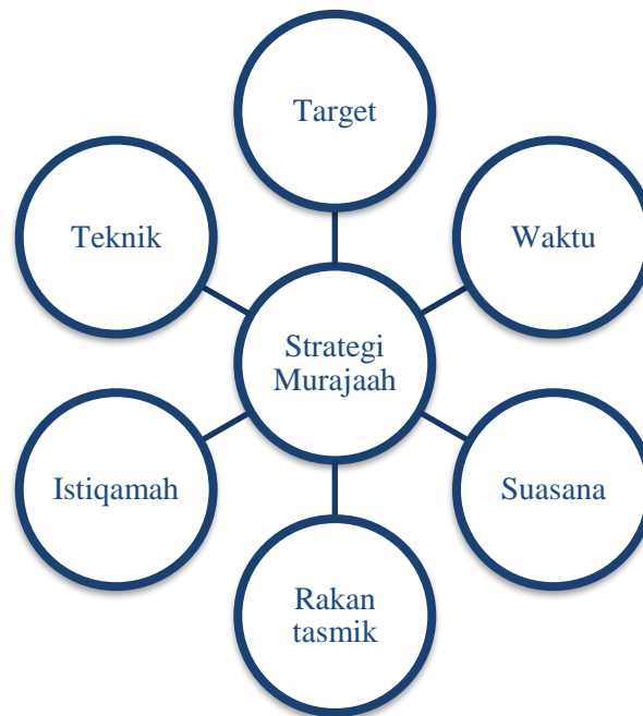
Rajah 1: Enam strategi utama murajaah al-Quran bagi huffaz di peringkat tertiar.

Berdasarkan analisis terhadap proses hafazan dan murajaah al-Quran serta realiti yang dihadapi oleh huffaz di peringkat tertiar, kajian ini merumuskan terdapat enam strategi utama (Rajah 1) boleh diimplementasi oleh huffaz dalam rangka untuk terus komited dan bermotivasi untuk melakukan murajaah al-Quran. Strategi murjaah al-Quran ini berkait rapat antara satu sama lain dan kadar keberkesanannya adalah relatif dengan amalan kebiasaan. Ini bermaksud, kajian ini mengantisipasi bahawa sekiranya keenam-enam strategi ini menjadi kebiasaan, huffaz di peringkat tertiar akan lebih terampil dari aspek penguasaan hafazan kerana dengan menggabungkan kesemua strategi ini, huffaz akan dapat mengekalkan momentum murajaah al-Quran.