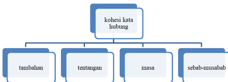
Rajah 1: kerangka kohesi kata hubung dalam kajian ini

dan, lalu, malahan, tambahan pula, lebih-lebih lagi, di samping itu dan selanjutnya. Penghubung tentangan pula merujuk penghubung yang menunjukkan pertentangan maklumat antara suatu yang baharu diperkatakan dengan yang sebelumnya dalam wacana yang sama. Contoh penghubung tentangan ialah, tetapi, sebaliknya, namun begitu dan walau bagaimanapun. Menurut Nik Safiah et al. (2008) penghubung sebab musabab pula ialah penanda wacana yang merupakan sebab berlakunya sesuatu seperti, kerana, oleh sebab, oleh itu, oleh hal demikian, dengan itu dan maka itu. Penghubung masa atau ketika pula merujuk penanda penghubung yang menunjukkan urutan masa atau siri berlakunya sesuatu. Contohnya, mula-mula, pertama, seterusnya, kemudian, selanjutnya, selepas itu, maka dan akhirnya. Huraian oleh Nik Safiah et al. (2008) ini menyamai huraian tautan penghubung ayat yang dikembangkan oleh Sanat (2002) yang menghuraikannya sebagai hubungan antara sesuatu unit teks dengan teks yang lain melalui peranti tautan. Beliau juga berpandangan bahawa hubungan yang berbentuk linguistik ini boleh berlaku secara hubungan semantik, iaitu mengambil kira aspek makna sesuatu wacana itu. Kerangka kohesi kata hubung dalam kajian ini dapat dilihat seperti rajah 1 berikut: