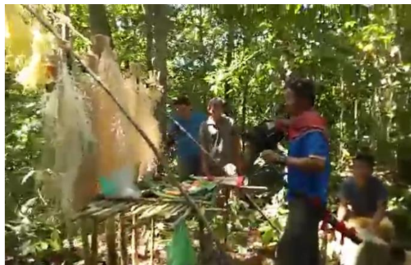
Rajah 4: Ritual Pakan yang dilaksanakan oleh masyarakat Penan bagi memohon restu daripada Retalak

Setiap masyarakat yang mengamalkan upacara ritual mempunyai pelbagai bentuk penghayatan untuk menterjemahkan di dalam bojek persembahan yang dikenali sebagai simbol. Dalam budaya masyarakat Salako, ayam atau babi merupakan simbol kesucian yang digunakan. Ayam atau babi yang digunakan dalam pelaksanaan ritual ini perlu disembelih dengan menggunakan pisau khas yang dikenali sebagai Ensuat Jubata 18 dan penyembelihan akan dilakukan seseorang yang pakar dan dilantik khusus semasa oleh Ketua Adat dan Ketua Kampung . Hal ini kerana proses penyembelihan adalah berlainan daripada penyembelihan biasa. Untuk tujuan ritual Nyangahant , ayam disembelih dengan menebuk sedikit pada bahagian bawah pipi ayam bagi memutuskan saluran makanan tanpa memutuskan saluran