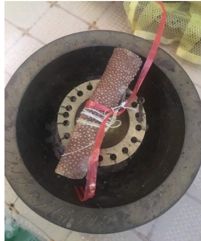
Rajah 3: Gabungan Kikir Ikan Pari dengan Cincin Emas di dalam pelaksanaan Tepung Tawar masyarakat Melayu Sarawak