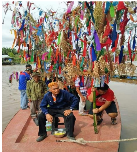
Rajah 2: Penghantaran Serarang oleh masyarakat Melanau Likow sebagai persembahan kepada Dewa ( Ipok )

Menurut Magiman & Yatim (2012), orang yang mempersembahkan barangan persembahan dan menyampaikan bahan persembahan kepada kuasa ghaib adalah merupakan pengamalan kepada kepercayaan tradisi. Di mana setiap bentuk persembahan yang dilaksanakan itu hendaklah mengikut aturan yang telah ditetapkan oleh komuniti pengamalnya. Unsur-unsur animisme ini sebenarnya merupakan amalan kepercayaan yang diturunkan oleh generasi terdahulu melalui jenis-jenis persembahan seperti makanan, barangan dan peralatan yang dipercayai menutrasikan krisis atau konflik dalam masyarakat pengamalnya.