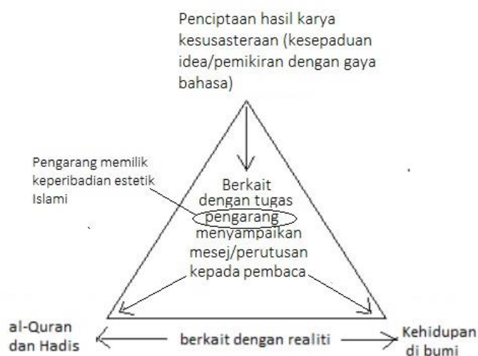
Rajah 2: Keadaman Teks Kesusasteraan dan Hubungannya dengan Keperibadian estetik Pengarang