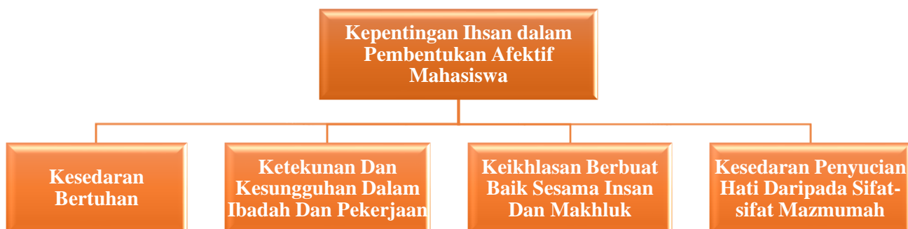
Rajah 2 : Kepentingan Ihsan Dalam Pembentukan Afektif Mahasiswa

Bagi membentuk afektif mahasiswa, nilai ihsan perlulah diterapkan dalam melahirkan mahasiswa yang holistik. Berikut merupakan kepentingan ihsan iaitu dapat membantu dalam menghadirkan kesedaran bertuhan, ketekunan dan kesungguhan dalam ibadah dan pekerjaan, keikhlasan berbuat baik sesama insan dan makhluk dan kesedaran penyucian hati daripada sifat-sifat mazmumah.