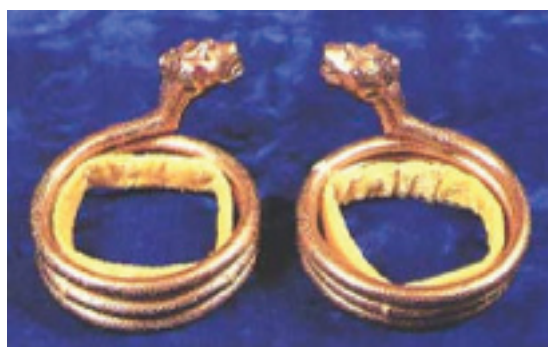
Rajah 3 Pontoh Bernaga.

Pontoh dalam teks tersebut bermaksud gelang besar daripada emas atau perak yang berukir naga atau merak yang dipakai di lengan di atas siku atau di atas pergelangan tangan. 17 Perhiasan pontoh ini merupakan salah satu daripada komponen set persalinan lengkap yang dianugerahkan oleh raja kepada orang tertentu yang menepati makna “pakaian selengkap” atau “peralatan lengkap”. Penganugerahan peralatan perhiasan yang terdiri daripada hiasan dahi dan pontoh pada pangkal lengan diberikan berdasarkan pangkat dan status masing-masing pada sepatutnya. Penerima anugerah darjah yang tinggi seperti Bendahara dan anak raja disimbolkan melalui perhiasan pontoh bernaga emas permata. Antara jenis pontoh yang lain termasuklah pontoh bernaga dengan penangkal dan azimat, pontoh berpenyangga sahaja, pontoh diperbuat daripada halkah biru dan pontoh yang diperbuat daripada perak. Semakin