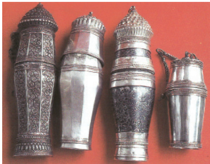
Rajah 1 Pekapuran.

Perkataan “pekapuran” di atas bermaksud bekas yang diperbuat daripada logam sebagai tempat mengisi kapur untuk disapu pada daun sirih. 6 “Halkah” pula bermaksud gelang 7 yang terdapat pada penutup bekas pekapuran tembaga tersebut dan badan pekapuran tersebut. Kedua-dua gelang tersebut dihubungkan dengan “rantai”. Pekapuran mempunyai pelbagai saiz dan bentuk seperti silinder, bujur, bulat, separa bulat, bersegi enam dan bersegi lapan. Pekapuran merupakan satu daripada komponen peralatan memakan sirih. Di sesetengah tempat, seperti