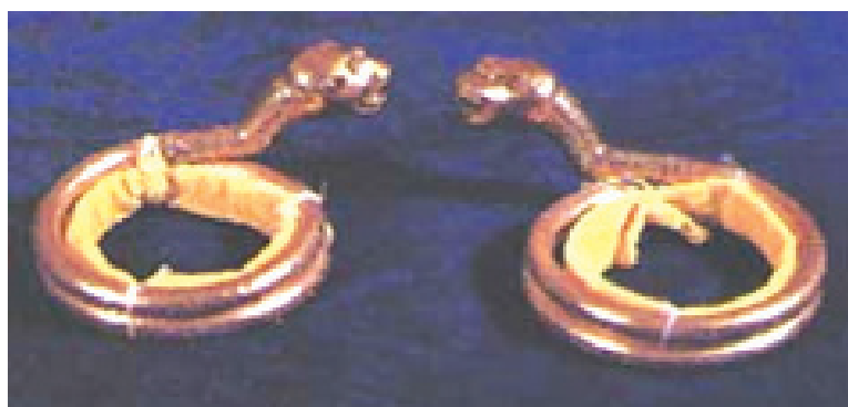
Rajah 4 Pontoh Ular Lidi.