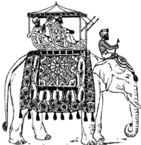
Rajah 9 Rengga.

Dalam hikayat Melayu, penggunaan rengga sering dikaitkan dengan gajah. Menunggang gajah pula hanya dikhaskan kepada golongan raja atau pembesar kerana penggunaan gajah melambangkan kemewahan dan status tinggi seseorang. Oleh sebab itu, kebiasaannya rengga dihiasi dengan indah dengan intan permata. Terdapat juga rengga yang dimiliki oleh para bangsawan ini diperbuat daripada logam yang mahal seperti emas. Dalam Sejarah Melayu, kerap kali diceritakan raja-raja menunggang gajah semasa pergi berburu atau pergi melawat negeri lain. 59