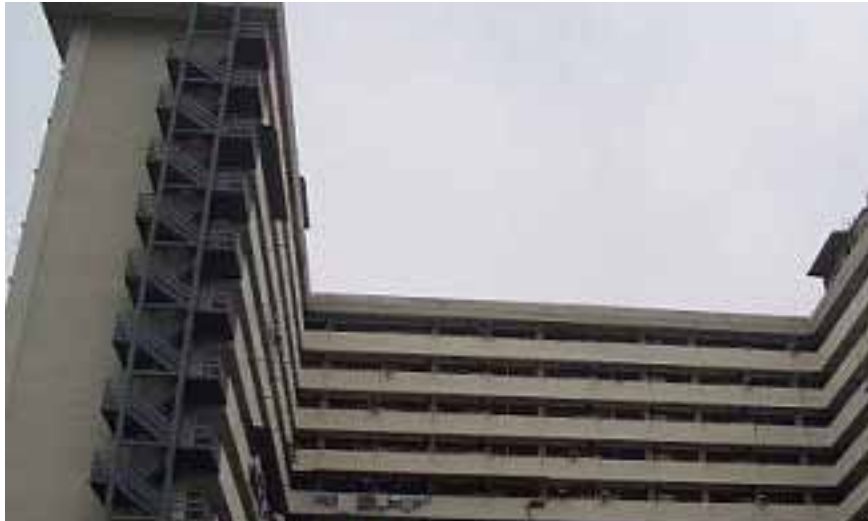
Rajah 1 Rumah pangsa 17 tingkat di Kampung Kerinchi, Kuala Lumpur.

Rumah pangsa 17 tingkat yang terletak di Kampung Kerinchi, Kuala Lumpur telah dipilih sebagai tempat kajian. Data berdasarkan soal selidik dan temu bual terhadap 47 buah keluarga Melayu berpendapatan rendah yang menetap di rumah pangsa tersebut. Kesemua responden merupakan masyarakat Melayu yang beragama Islam yang terdiri daripada guru, kerani, peniaga kecil, pemandu teksi, pekerja kilang dan buruh kasar.