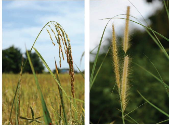
Foto 1 Padi ( Oryza sativa ) dan lalang ( Imperata cylindrical ).