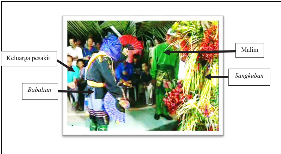
Rajah 1 Suasana upacara barasik di Padas Damit, Beaufort, Sabah

Rajah 1 memaparkan suasana barasik yang dilakukan pada waktu malam. Upacara ini diketuai oleh babalian . Malim pula bertugas sebagai pembantu kepada babalian dan menyampaikan mesej kepada ahli keluarga pesakit, selain berperanan menyediakan hidangan dan keperluan asas barasik . Sangkuban diletakkan di tengah di mana babalian akan menari sambil membaca mantera. Terdapat tujuh mantera dibacakan oleh babalian sehingga upacara ini selesai. Masing-masing mempunyai tujuan tersirat yang disampaikan kepada ahli keluarga pesakit. Berikut adalah pergerakan tari babalian yang dipaparkan dalam visual bergambar.