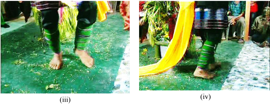
Rajah 2 Pergerakan tari dan bahagian kaki

Rajah 2 menunjukkan gerak tari bahagian kaki babalian dalam tarian Sayau Babalian . Unsur spiritual yang terdapat dalam gerak tari ini bertujuan memanggil makhluk halus turun ke bumi dengan menggunakan selendang berwarna kuning. Unsur perlambangan warna kuning mewakili kumpulan makhluk halus. Gerak tangan menggunakan kipas menunjukkan babalian sedang berunding dengan makhluk halus supaya semangat pesakit dapat dipulihkan dan penyakit dapat diubati seperti yang ditunjukkan pada Rajah 2 (i). Pergerakan tari kaki ke kiri dan ke kanan, manakala kaki kiri atau kaki kanan akan menyentuh lantai seperti Rajah 2 (ii). Kedua-dua kaki kiri dan kanan terbuka membentuk sudut 45 darjah dengan tumit menyentuh antara satu sama lain. Tumit kaki kiri digerakkan ke tepi bersama-sama dengan bahagian hadapan kaki kanan yang menggunakan tumitnya. Ia akan membentuk huruf 'V'. Prinsip yang sama juga digunakan untuk kaki kiri dan tumit kanan digerakkan ke tepi menjadikan bentuk 'V' biasa seperti Rajah 2 (iii). Pergerakan kaki berlaku apabila bersilang ke kanan dan kiri. Kaki bersilang menuju ke arah kanan dan ke arah kiri seperti Rajah 2 (iv). Gerak bahagian kaki merupakan gerak asas tari tradisi seperti kaki berjengket, bergeser atau sambil bergerak melakukannya atau kaki bergerak seperti campak lenggang, berjalan depan belakang, bergerak ke kiri dan kanan.