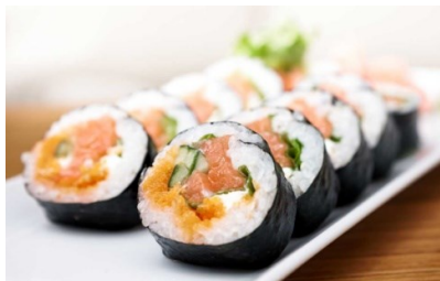
Rajah 3: Sushi (Diyana, 2017)

Perkataan “Jepun” dan “Itali pula merupakan nama tempat atau negara [ How Many Countries are there in the world? (t.t)]. Hawaii ialah sebahagian daripada negara Amerika Syarikat (Heckathorn, Motteler & Swenson, t.t).