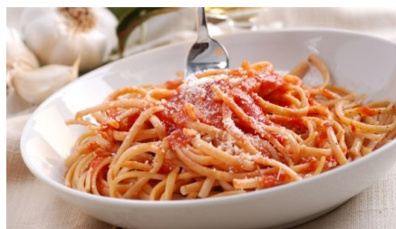
Rajah 2: Spagetti

Resipi spageti asalnya dari Itali, salah satu jenis pasta yang paling popular dan mempunyai pelbagai hidangan yang berbeza mengikut tempat ( Spaghetti recipes , t.t). Menurut Coy (2016), kebanyakan orang apabila ditanya tentang makanan Itali yang menjadi kegemaran mereka, akan terbayang satu pinggan besar dengan mi spageti yang dihiasi dengan sos daging yang hangat dan bebola yang bersup.