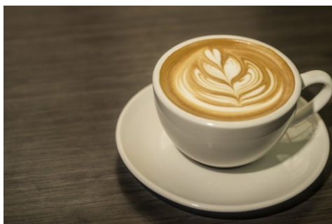
Rajah 2: Kopi "espresso".

Mengapakah "minum kopi dan makan spageti di Itali" pula? Kopi Espresso ialah sejenis kopi pekat ala Itali yang disediakan dengan cara melalukan air mendidih atau wap pada biji kopi yang telah dikisar dan dihidangkan tanpa gula dan susu. Kapucino pula sejenis minuman kopi yang juga berasal dari Itali, dicampurkan dengan susu dan dibuat berbuih dan biasanya ditaburi serbuk coklat (Siti Suhana Mohd Amir, t.t.). Menurut Siti Suhana Mohd Amir lagi, minuman kopi bukan sekadar dapat mengurangkan rasa mengantuk, malah memberikan ruang dan peluang dalam mempopularkannya dengan keperluan dan status gaya hidup masyarakat kini. Minum kopi dapat melawan kemurungan dan menjadikan hari anda lebih gembira atas faktor gaya hidup kini yang dibebani masalah kerja dan sebagainya. Menurut Bizzarri (2017), rakyat Itali masih mempertahankan reputasi negaranya sebagai "ibu kota kopi dunia". Reputasi Itali tersebut ada kaitan dengan sumbangan penciptanya, Milan Luigi Bezzera yang menghasilkan minuman kopi yang diberikan nama "espresso" pada tahun 1901.