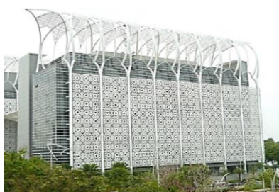
Rajah 2: JAKIM Presint 3, Putrajaya