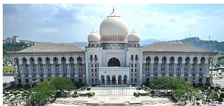
Rajah 1 : Mahkamah, Presint 3, Putrajaya