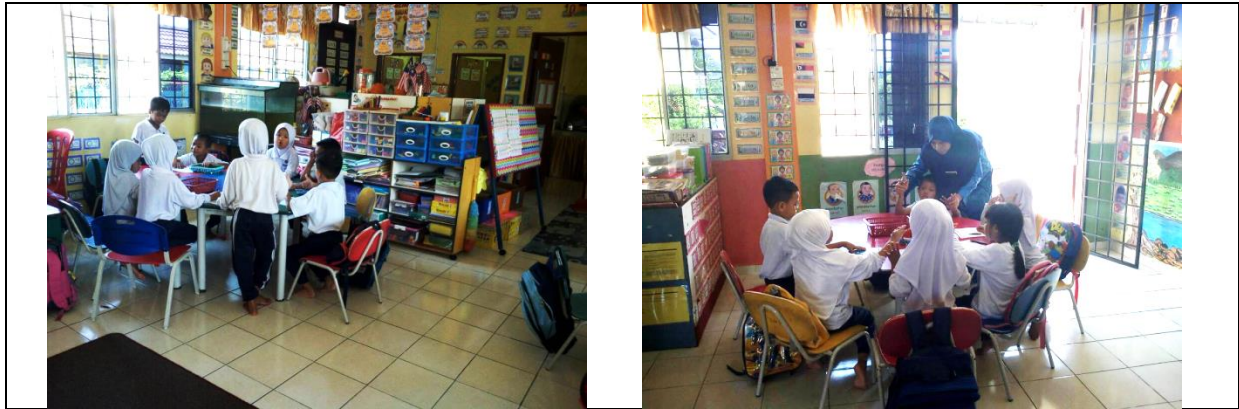
Rajah 2. Suasana dalam bilik darjah sebelum aktiviti mewarna dijalankan untuk kajian ini.

Dari segi susunan tempat duduk, walaupun murid dibahagikan sama rata mengikut dua set kerusi dan meja, pergerakan mereka tidak dihadkan bagi mengekalkan suasana bilik darjah yang normal dan semula jadi. Kajian ini mengekalkan susun atur bilik darjah, guru dan aktiviti mewarna yang biasa di dalam kelas (Gliner et al. , 2011). Rajah 2 menunjukkan suasana dalam bilik darjah sebelum aktiviti mewarna dijalankan di Prasekolah A.