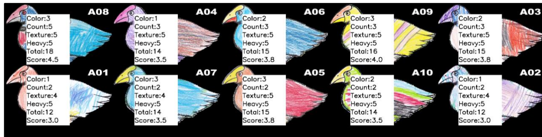
Rajah 5. Hasil imbasan lembaran kerja selepas ujian pasca.

Data yang dikumpul dalam kuasi eksperimen ini telah dianalisis dengan menggunakan ujian non-parameter Wilcoxon Signed Rank bagi menjawab kelima-lima soalan kajian. Jadual 3 menunjukkan dapatan kajian perbandingan kumpulan rawatan bagi keempat-empat konstruk kreativiti.