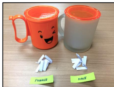
Rajah 1. Persampelan rawak mudah yang digunakan untuk menentukan peserta kajian ini.

Penentuan peserta kajian ini adalah mengikut kaedah persampelan rawak mudah, iaitu lima nama dikeluarkan secara rawak daripada setiap jantina (Rajah 1).